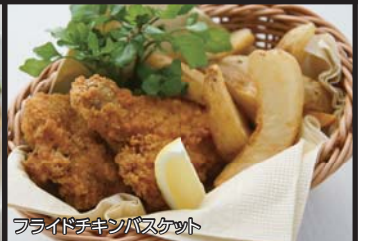
フライドチキンバスケット

フライドポテト ¥450 サワークリームとスイートチリソース Fried Potato with Sour Cream & Sweet Chili Sauce