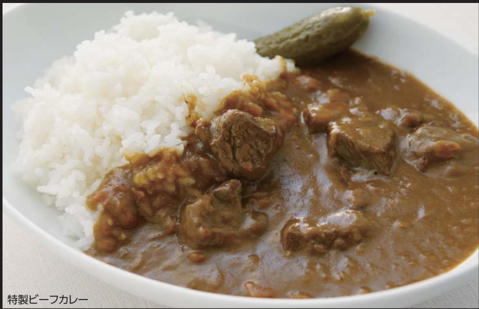
特製ビーフカレー

特製ビーフカレー ¥830 Original Beef Curry & Rice 大盛り ¥980