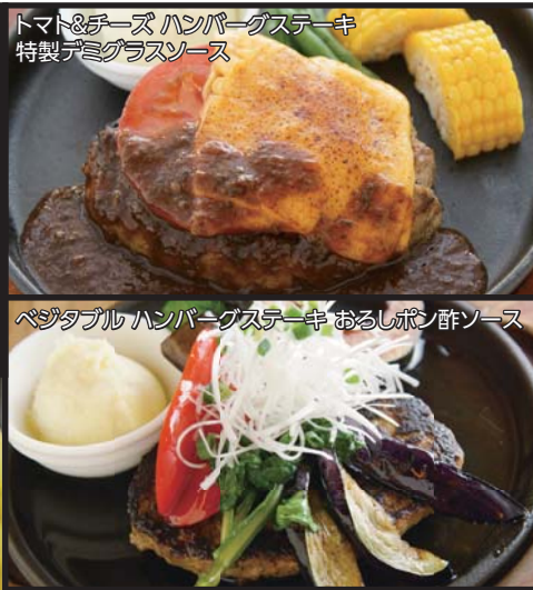
トマト&チーズ ハンバーグステーキ 特製デミグラスソース