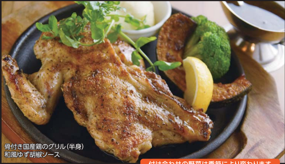
骨付き国産鶏のグリル(半身) 和風ゆず胡椒ソース