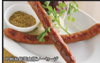
九州糸島雷山豚ソーセージ