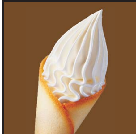
プレミアム生クリームソフト クレミア