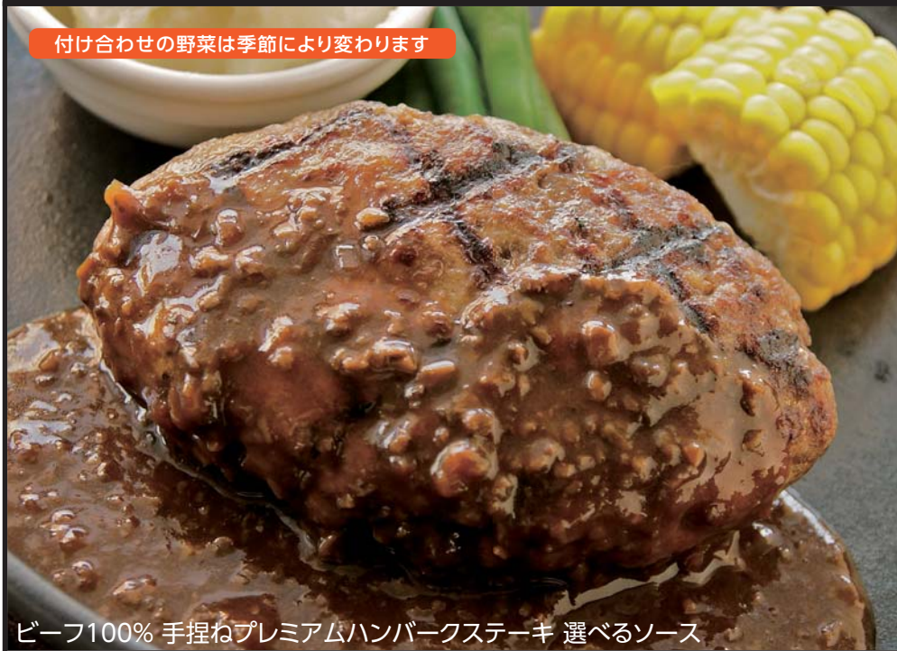
ビーフ100% 手捏ねプレミアムハンバーグステーキ 選べるソース