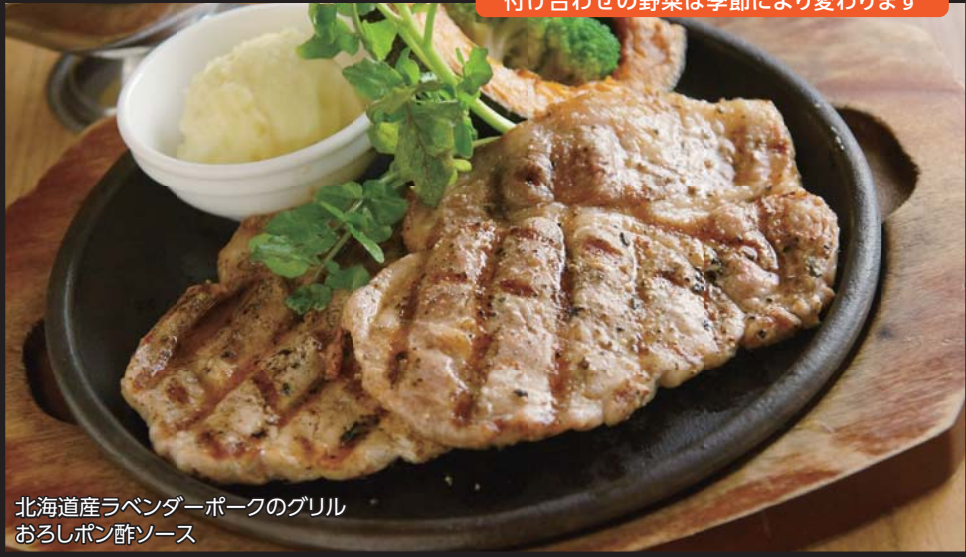
北海道産ラベンダーポークのグリル おろしポン酢ソース

骨付き国産鶏のグリル(半身) 和風ゆず胡椒ソース ¥1,560 Grilled 1/2 Chicken with Yuzu Pepper Sauce 【ライス】または【パン】付き