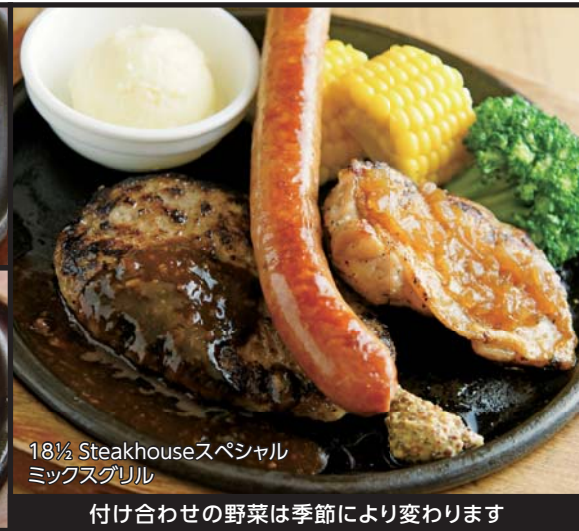
18½ Steakhouseスペシャル ミックスグリル