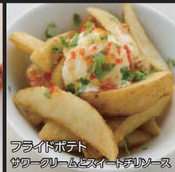
フライドポテト サワークリームとスイートチリソース