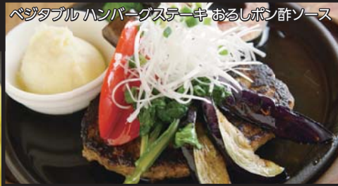
ベジタブル ハンバーグステーキ おろしポン酢ソース