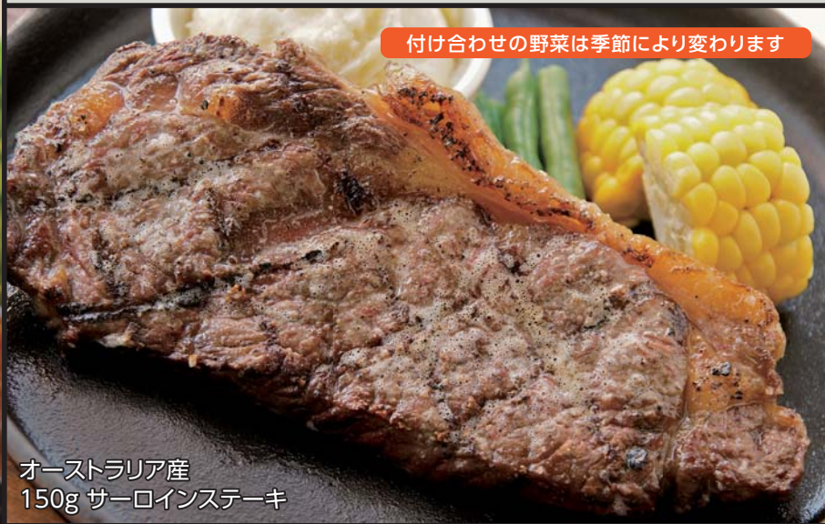
オーストラリア産 150g サーロインステーキ